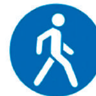
4.5 «Пешеходная дорожка»

Там, где он висит, смело можно ехать на любых велосипедах, даже на таких, которые снабжены моторчиком.