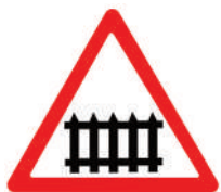
1.1 «Железнодорожный переезд со шлагбаумом»

Он не разрешает переход в том месте, где установлен. Этот знак для водителя. Он предупреждает, что впереди – через 50-300 метров будет пешеходный переход и надо снизить скорость.