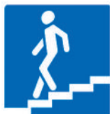
6.6 «Подземный переход»

Для пешеходов особенно важны знаки, которые информируют о подземном и надземном пешеходных переходах.