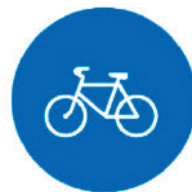
4.4 «Велосипедная дорожка»

Здесь машины друг за другом Мчатся весело по кругу. Что такое, в самом деле, Словно мы на карусели? Мы на площади с тобой, Где дороги нет прямой.