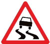
1.15 «Скользкая дорога»

Эти знаки устанавливаются вблизи железнодорожных переездов. Они служат прежде всего для регулирования движения транспорта. Однако пешеходам в целях безопасности тоже нужно дожидаться, пока поезд проедет и шлагбаум откроется. Остановить мчащийся на полной скорости поезд ещё труднее, чем автомобиль, по-этому на переезде нужно быть вдвойне внимательными, и уж тем более не играть вблизи железной дороги!