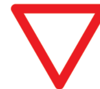
Знак 2.4 «Уступите дорогу»

Не спеши, не торопись, Вперёд внимательней взглядишь. И с педали газа убери-ка ногу – Знак говорит: уступи дорогу.