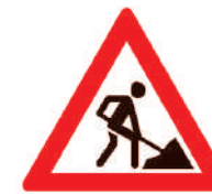
Знак 1.25 , на котором нарисован человек с лопатой, называется « Дорожные работы ».

Знаком обозначают участок дороги, где имеются опасности, не предусмотренные другими предупреждающими знаками. Характер «опасности» может быть детализирован дополнительной табличкой или надписью, которые, как правило, размещаются под знаком.