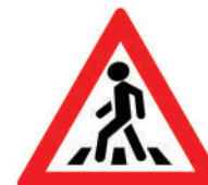
1.22 «Пешеходный переход»

Он предупреждает водителя, что поблизости находится детское учреждение или игровая площадка. И на проезжую часть могут неожиданно выбежать дети. Но этот знак не обозначает место для перехода!