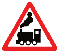
1.2 «Железнодорожный переезд без шлагбаума»

Эти знаки устанавливаются вблизи железнодорожных переездов. Они служат прежде всего для регулирования движения транспорта. Однако пешеходам в целях безопасности тоже нужно дожидаться, пока поезд проедет и шлагбаум откроется. Остановить мчащийся на полной скорости поезд ещё труднее, чем автомобиль, по-этому на переезде нужно быть вдвойне внимательными, и уж тем более не играть вблизи железной дороги!