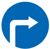
4.1.2 «Движение направо»

Знаки указывают направление движения по дороге, другие действия. Например, если стрелка на знаке указывает вправо, то здесь ехать надо только направо. Знак со стрелкой влево означает, что надо поворачивать налево. Знак, на котором изображена стрелка, смотрящая вверх, указывает, что здесь можно ехать только прямо.