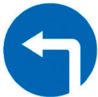
4.1.3 «Движение налево»

Стрелки, словно на распутье В сказке про богатырей – Прямо ехать, повернуть ли? Отгадай, дружок, скорей.