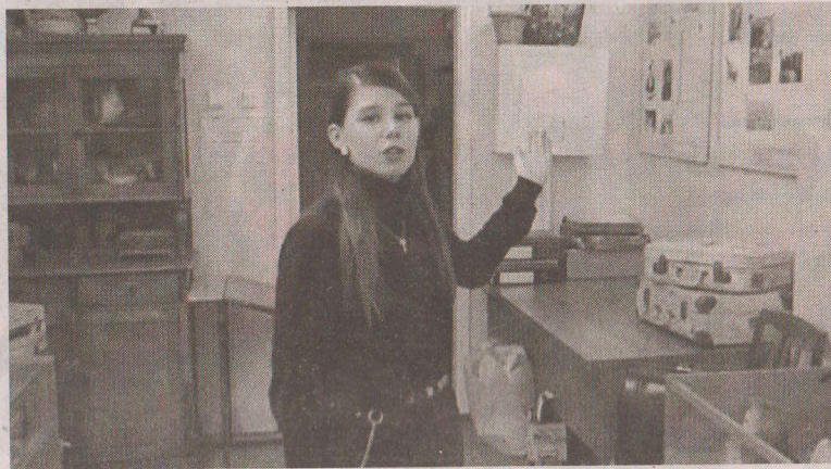
Презентация проекта «Перемены к лучшему начнем с музея».

Идея проекта родилась не на пустом месте. Каждому ученику, который любит свою школу и свой город, важно, чтобы память о них осталась для потомков. Музейная комната гимназии, открытая в 2002 году, хранит огромное количество экспонатов, не только отражающих тридцатилетнюю историю гимназии № 1, но и свидетельствующих о жизни, увлечениях, занятиях, традициях жителей микрорайона Зеленый клин. Наш проект направлен на формирование гражданской позиции у обучающихся, привитие патриотических чувств по отношению к родно-